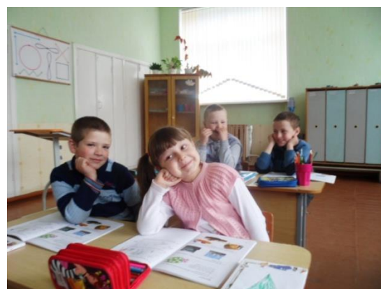
Витать в облаках