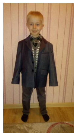
С чужого плеча