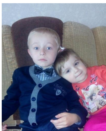
Не разлить водой