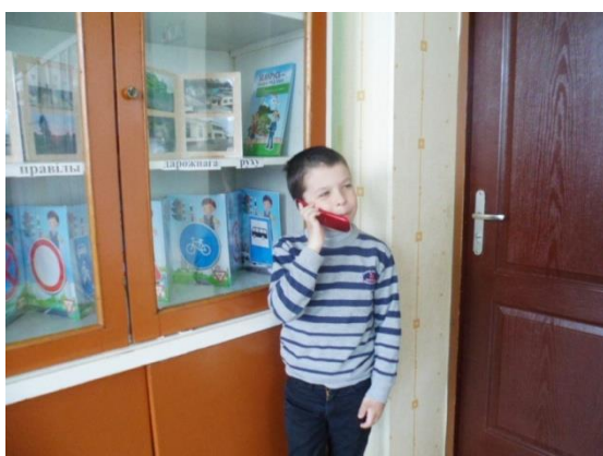
Висеть на телефоне